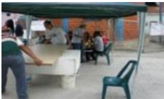
(La gente está preparando la elección de los voceros y voceras del Consejo Comunal)

Cuando había elecciones de los voceros y las voceras del Consejo Comunal, la gente mostró mucho interés en participar, así como estar en el local durante un día entero, mientras se procesaba la elección y se nominaban los cargos. En ese día de votaciones, los miembros no mostraban ninguna apatía o indiferencia; al contrario, la gente estaba interesada en lo que hacían los demás, e incluso parecía que se divertían del escenario de la elección, como si fuera una fiesta local.